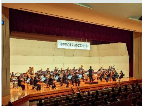
中学生の未来に贈るコンサート