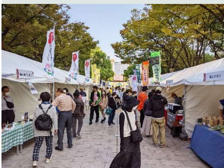
ふくおか町村フェアの様子